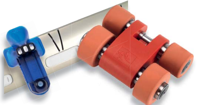
Triángulo de torcido EliTwist®

El procedimiento de hilado EliTwist® combina el hilado compactado y el retorcido en una sola operación. Se produce un hilo retorcido a dos cabos con torsión en la misma dirección para ambos hilos individuales. El triángulo de torcido es muy pequeño; el número de roturas de hilo es también muy bajo aún para altas velocidades de los husos.